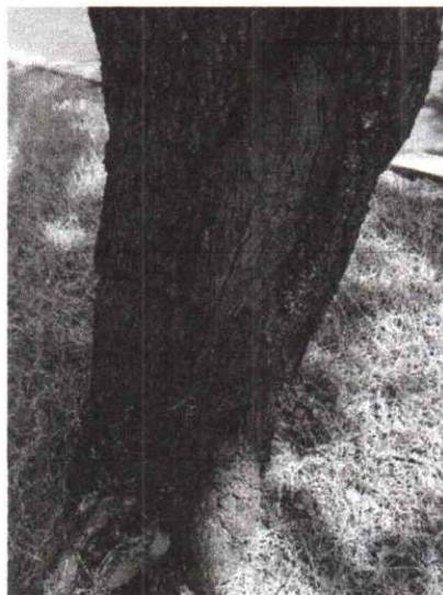
Foto 2. Laceraciones en la corteza de la base de uno de los árboles, lo que provoca posibles infecciones en el mismo y un posible contagio hacia los demás.