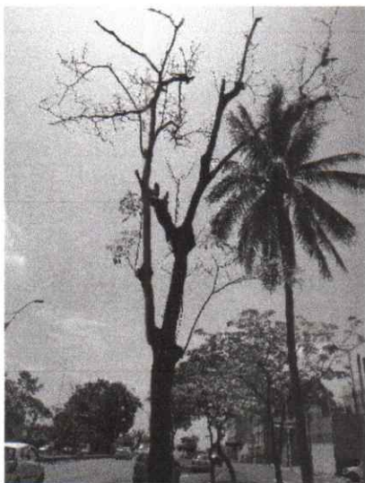
Foto 1. Macuilis longevo, donde se puede apreciar la caída de las hojas debido posiblemente por vejez y por falta de nutrientes.