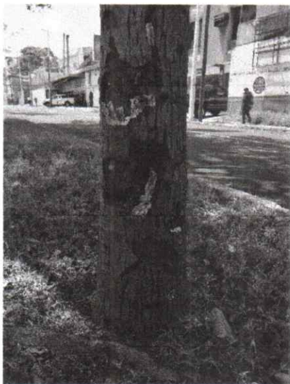
Foto 3. Cicatrices profundas en la corteza de la palmera, con presencia de hongos provocando un deterioro en el mismo.